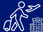
Accidentes y Salud