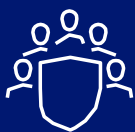
RC Administradores y Directivos